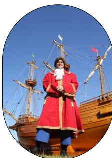
ガリバーも来るよ!!