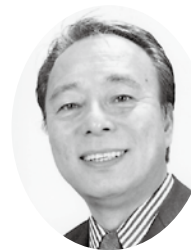
横須賀市体育協会会長

スポーツ界では、緊急事態宣言中ではありましたが、東京2020オリンピック・パラリンピックが開催されました。感染者数が増加している中、実施することに多くの意見がありました。結果的に日本中に元気を与えることになったのではないのでしょうか。スポーツの持つ力を改めて感じました。徐々にはありますが、街も賑わいを取り戻し、今までの日常が戻ってきたことを嬉しく思います。ただし、年末年始は人が集まる機会も増えるため、決して油断せず年を越すことが肝要だと思えます。気温も下がりがかなり寒いですが、こまめな換気をし、マスクの着用や消毒をすることでこの厳しい季節を乗り越えていきましょう。